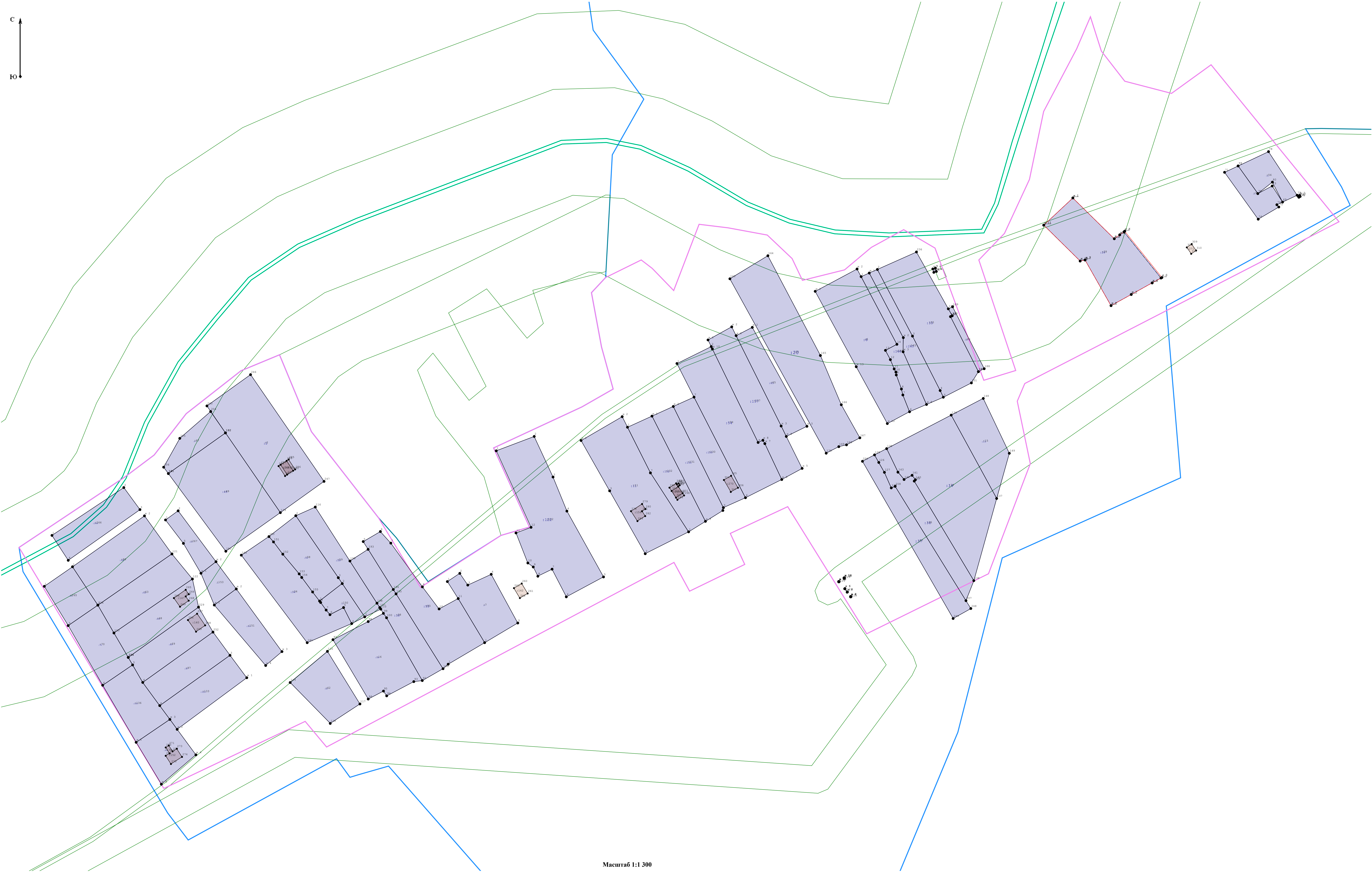
Масштаб 1:1 300