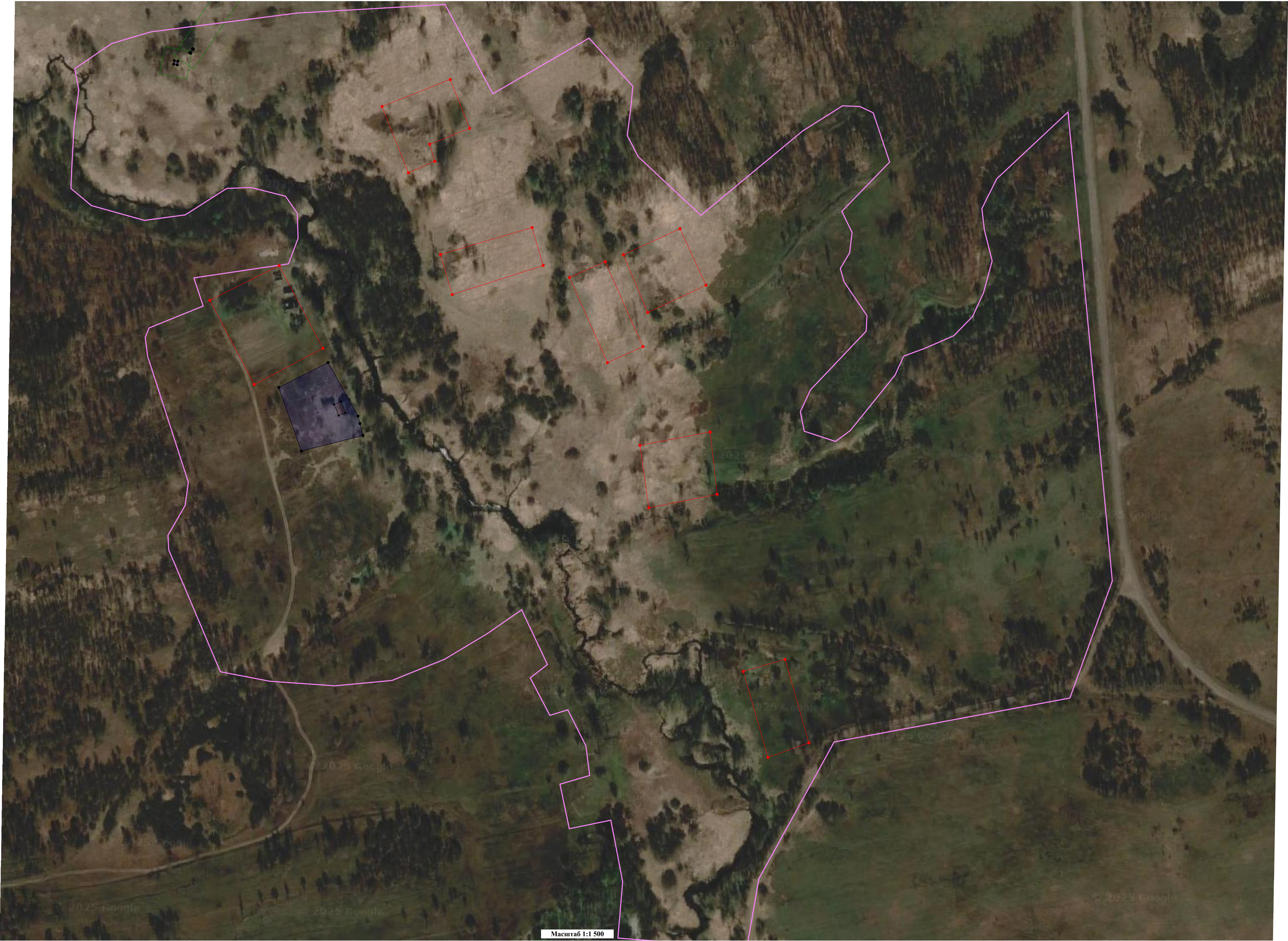
Масштаб 1:1 500